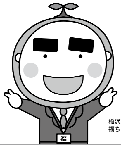
稲沢市社協マスコットキャラクター 福ちゃん