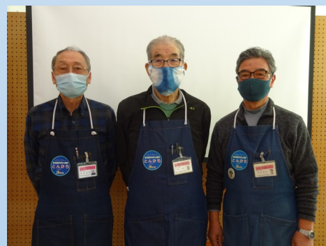
【講師】名古屋おもちゃ病院「とんかち」