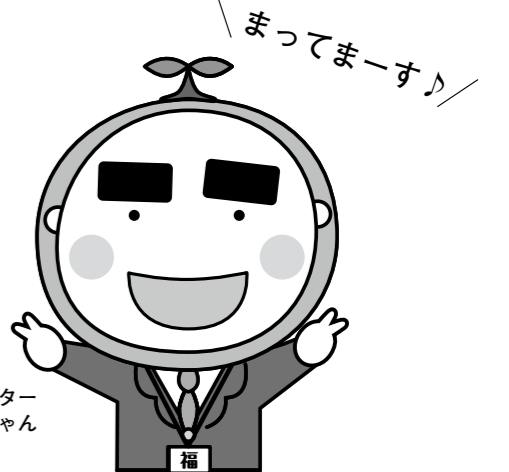
稲沢市社協マスコットキャラクター 福ちゃん