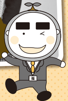
マスコットキャラクター 「福ちゃん」