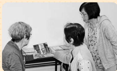
レコードを手に当時は思い出す参加者