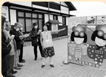
梅まつりガイドボランティアの説明を聞く会員

連絡会は、ボランティアセンターに登録するグループ、個人が会員となり、相互の交流、繋がり強化、研修会の開催などを通じ、地域にボランティア活動の輪を広げることを目的として活動しています。今回は、稲沢市を飛び出し、知多市で活動するボランティアと交流しました。会員それぞれの今後の活動や稲沢市におけるボランティア・市民活動活性化のヒントが得られたのではないのでしょうか。