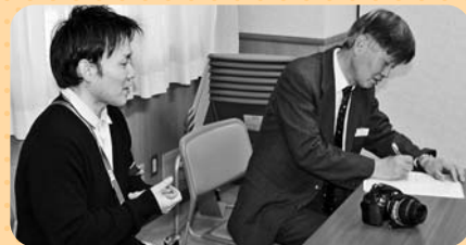
取材活動中の編集委員

経験豊富な編集委員が講師となり、はじめてのかたでもわかりやすい内容になっています。興味のあるかたは、是非ご参加ください。