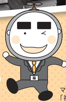
マスコットキャラクター 「福ちゃん」