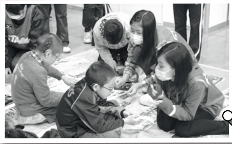
手作りフライングディスクのお手伝い