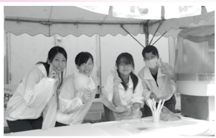
福祉まつりでの学生ボランティア