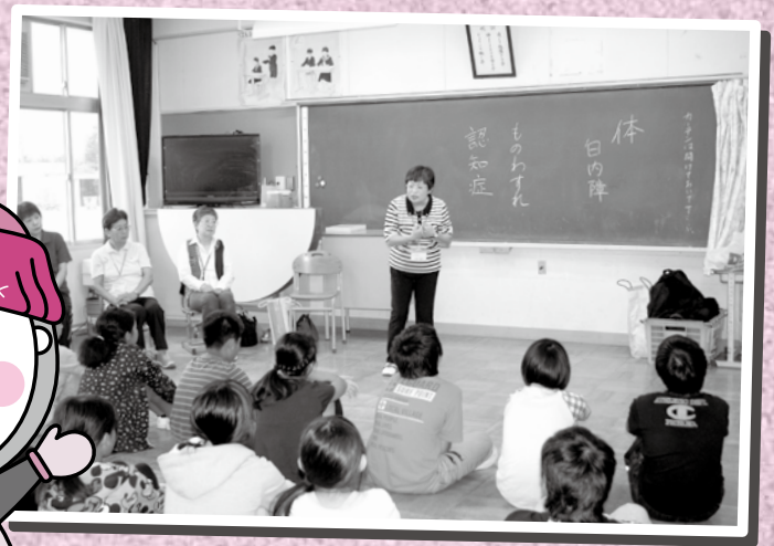
福祉実践教室で、若い世代と一緒に「高齢者の気持ち」について考えます

高齢者のかたの、ちょっとした お手伝いをしている ボランティアさんを紹介するよ。