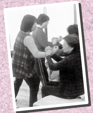
介護技術の勉強会 古武術を使った介護法を学びました