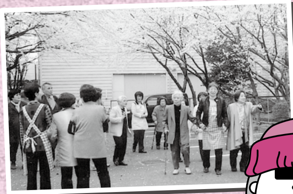
年に数回開催されるイベント「お花見会」へお出かけ